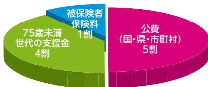
後期高齢者医療制度の費用負担